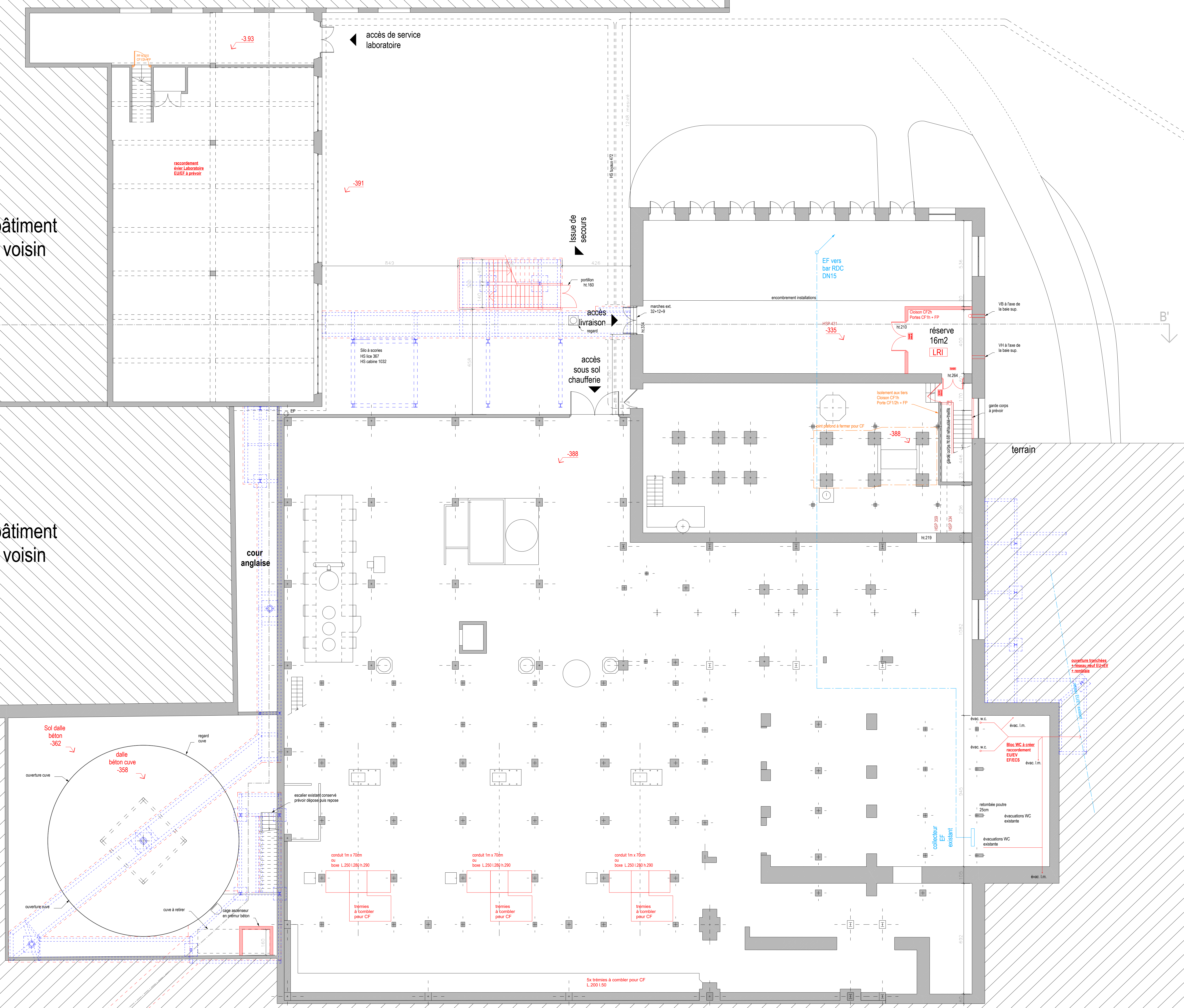
Rez de jardin de la chaufferie