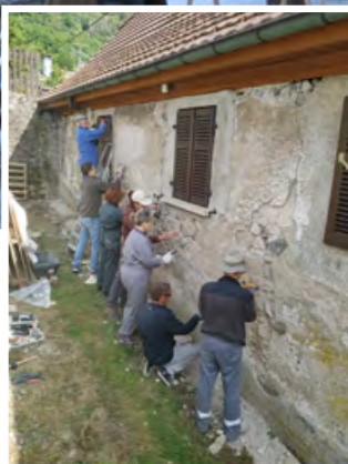
Chantiers participatifs sur une maison ancienne à Oderen